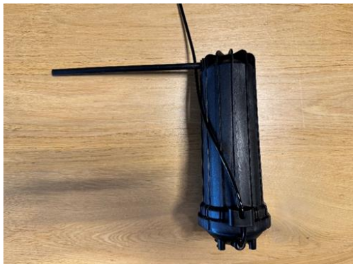
Teljes LS23FIL elosztócsővel